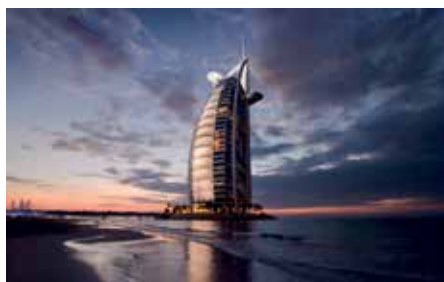
Burj Al Arab Hotel in Dubai, equipped with several lamp collections from Pedret Barcelona.

Noteworthy among our most emblematic projects are the collaboration with the Burj Al Arab Hotel in Dubai, considered to be the most luxurious in the world, but also fabulous corners in small hotels and restaurants spread around the world,