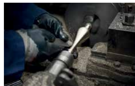
Mechanization of an ornamental element from Lorraine collection.

To continue learning this noble craft and to enhance its value with the help of architects and lighting designers, is the next