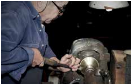
Repulsado artesanal de la lámpara Dust.

Durante más de 50 años, de los talleres de Pedret Barcelona han salido excepcionales lámparas de fundición elaboradas por algunos de los mejores artesanos del metal. Cada elemento, cada proceso, desde la fundición de los lingotes a su pulido, mecanizado, baño y montaje, se realizan con cuidado y destreza, conscientes que cada detalle, alberga el secreto de una obra excepcional.