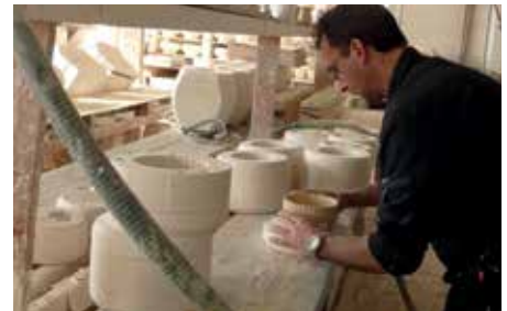
Fabricación de una pantalla de porcelana del modelo Brahma.

Seguir aprendiendo de este noble oficio y ponerlo de nuevo en valor de la mano de arquitectos y diseñadores de iluminación,